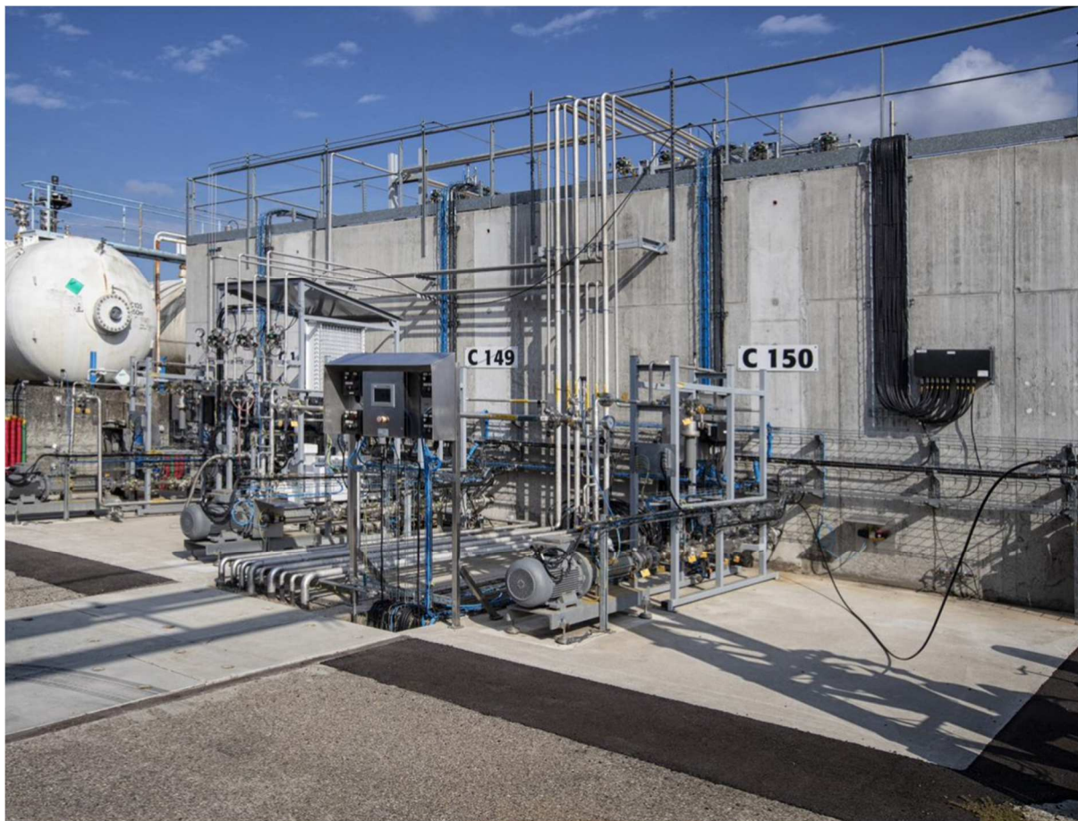
Réservoirs sous-talus à requalifier – Photo prise en 2022