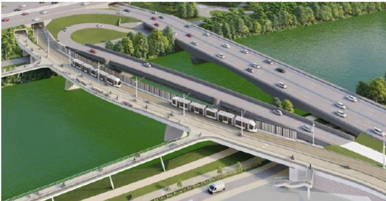
Figure 2: Photomontage du franchissement ouest du canal de Jonage au niveau de Croix-Luizet ( tramway et cycles, piétons )

L'Autorité environnementale recommande d'intégrer à l'évaluation environnementale, les aménagements constitutifs du projet et non développés dans l'étude d'impact, notamment leurs descriptions et leurs impacts éventuels ainsi que les mesures prises en conséquence.