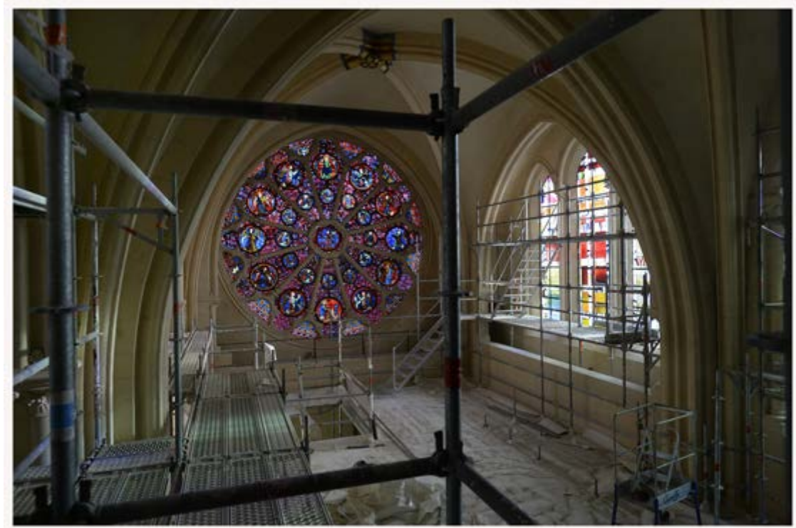
Installation des vitraux contemporains de Jean Mauret, Dominique Fleury et Gilles Rousvoal