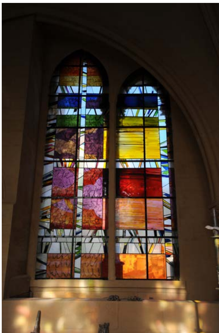
Vitraux contemporains de Jean Mauret, Dominique Fleury et Gilles Rousvoal