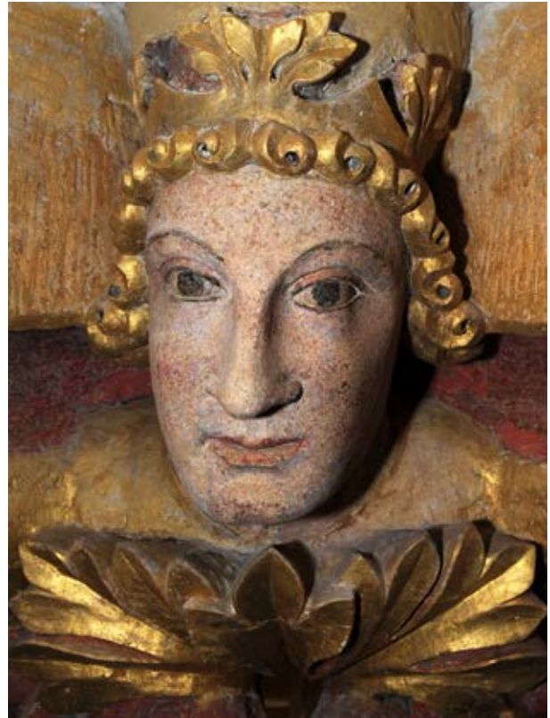
Figure de roi - clef de voûte 1ère travée de la nef avant et après restauration