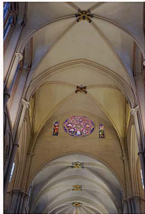
Clefs de voûte restaurées