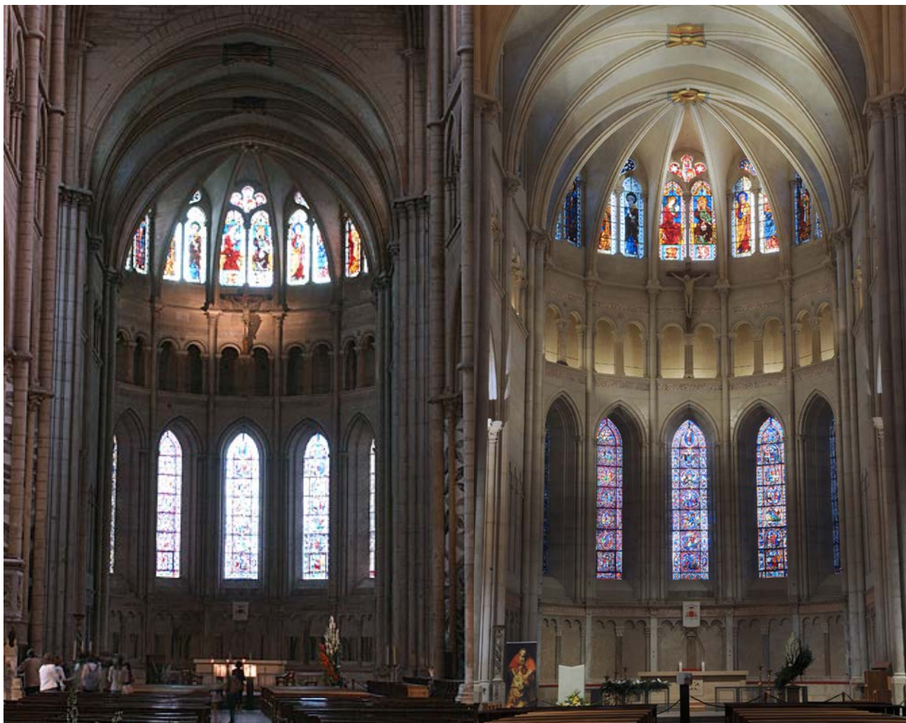
Vue du chœur avant restauration