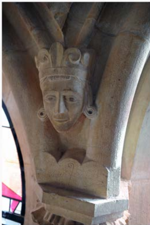
Visage sculpté - transept nord façade est