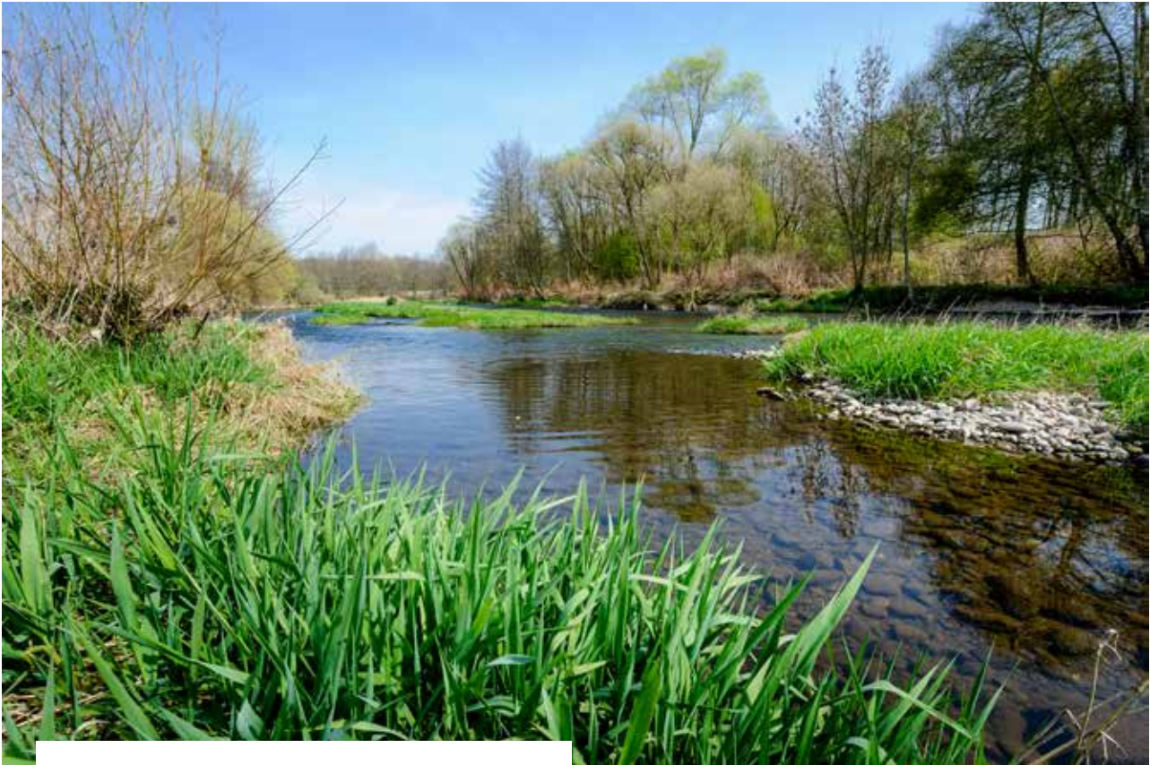
Ruisseau «Le Morbief» à La Corveraine (70)