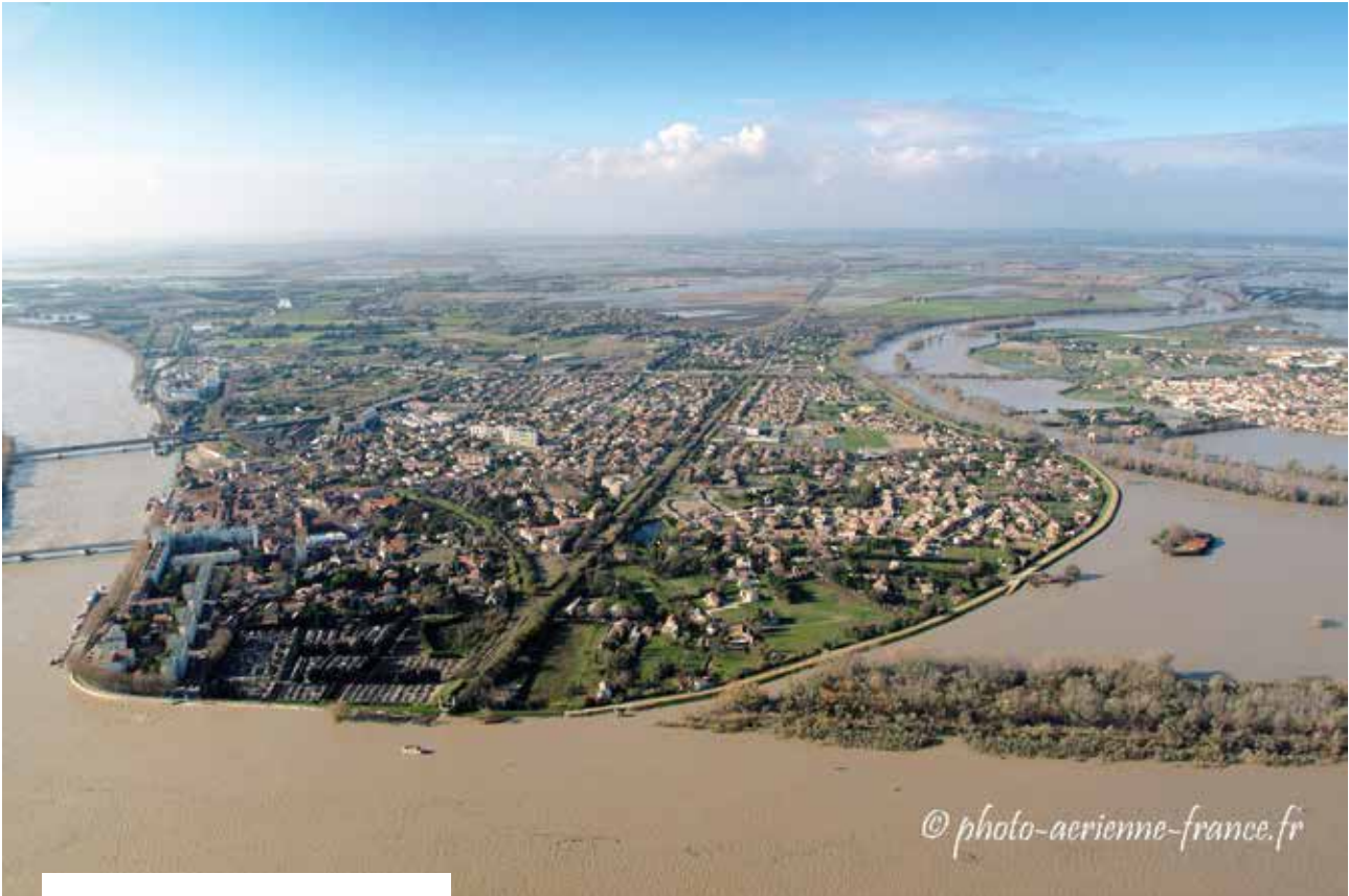
Le quartier Trinquetaille d'Arles