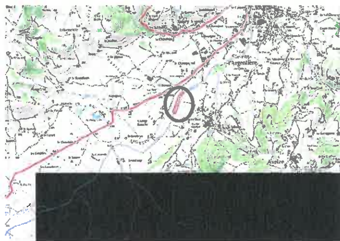
Plan de situation 1 : 25000

Vu pour être annexé à l'arrêté N° DDT_SEN_2019_12_23-C121