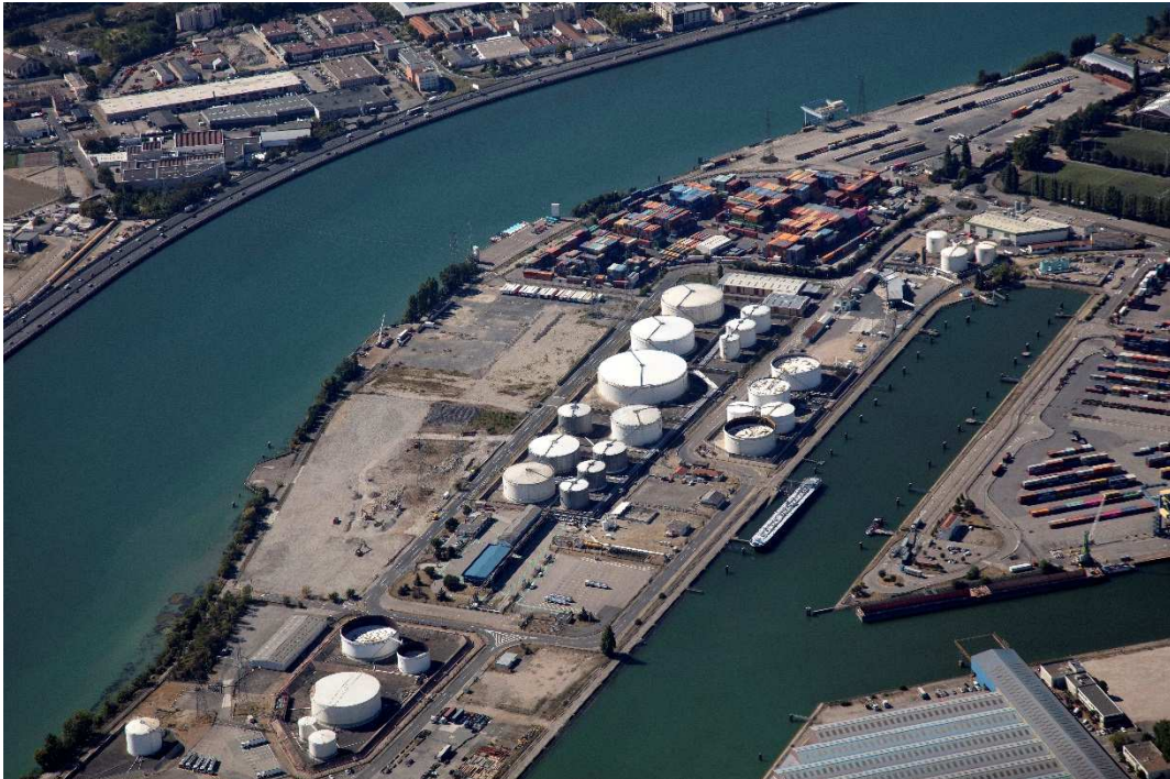
Vue aérienne du site EPL