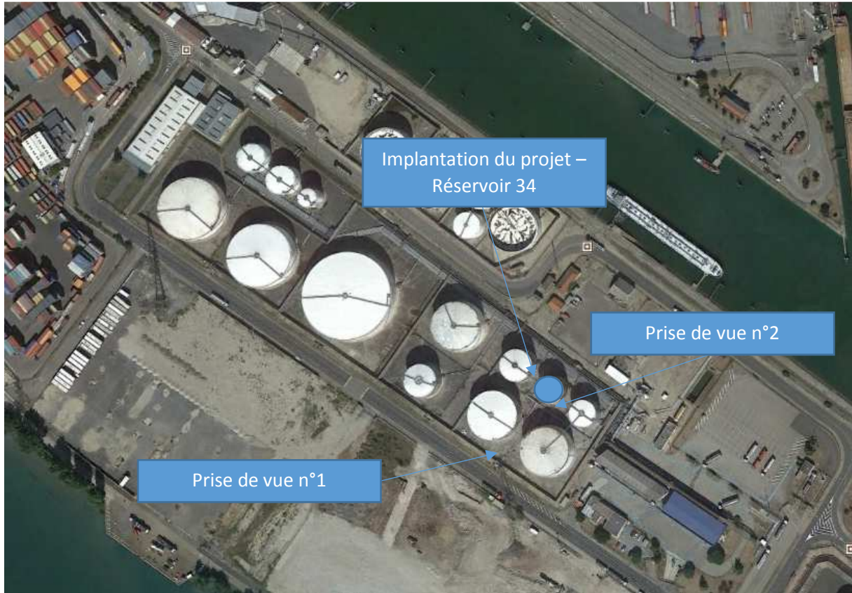
Localisation des prises de vue

Date de prise des photographies : 07/03/2019