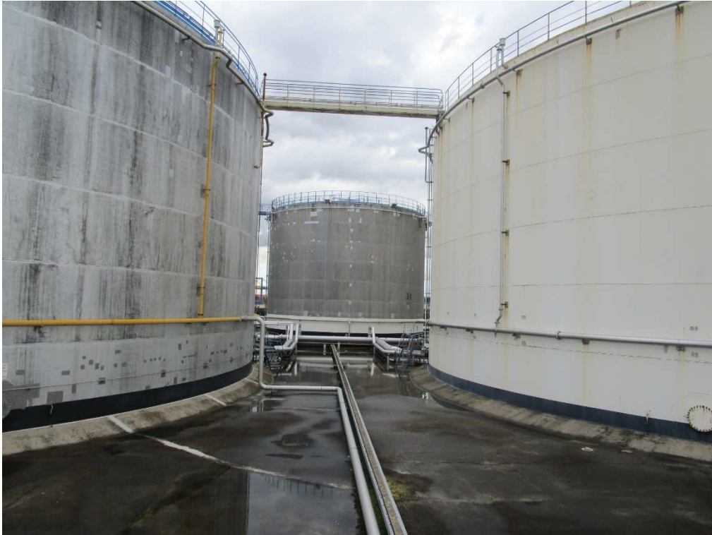
Prise de vue n°1