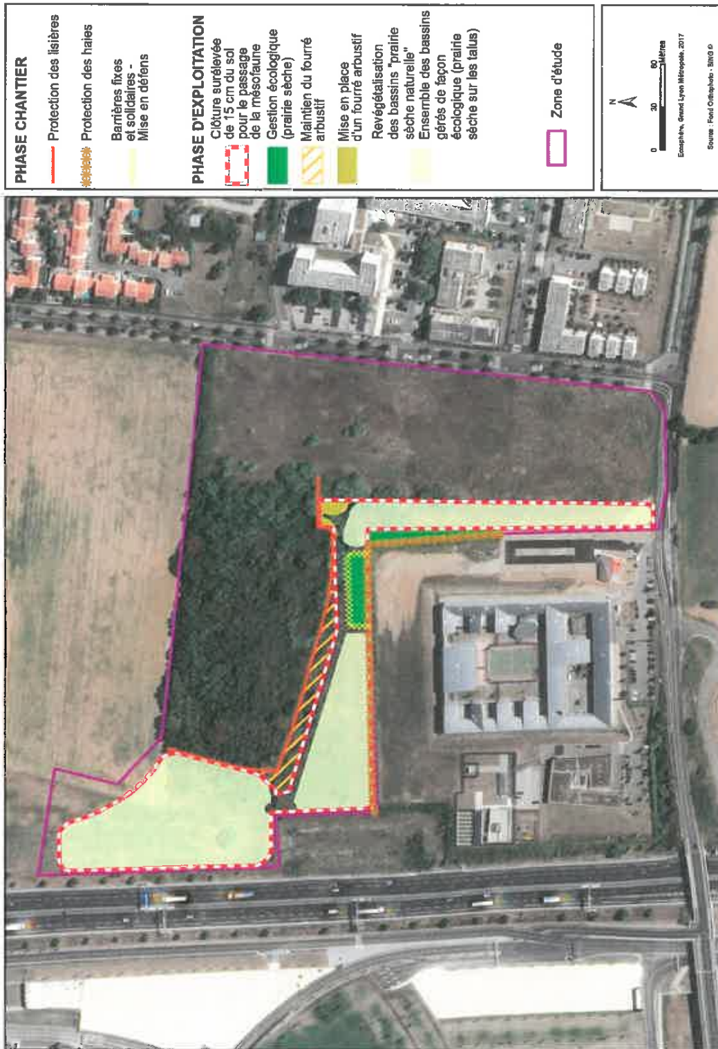
Principales mesures proposées en zone nord (site d'étude 1)