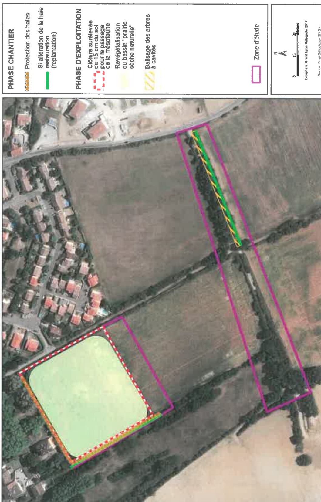
Principales mesures proposées en zone sud (sites d'étude 2 et 3)