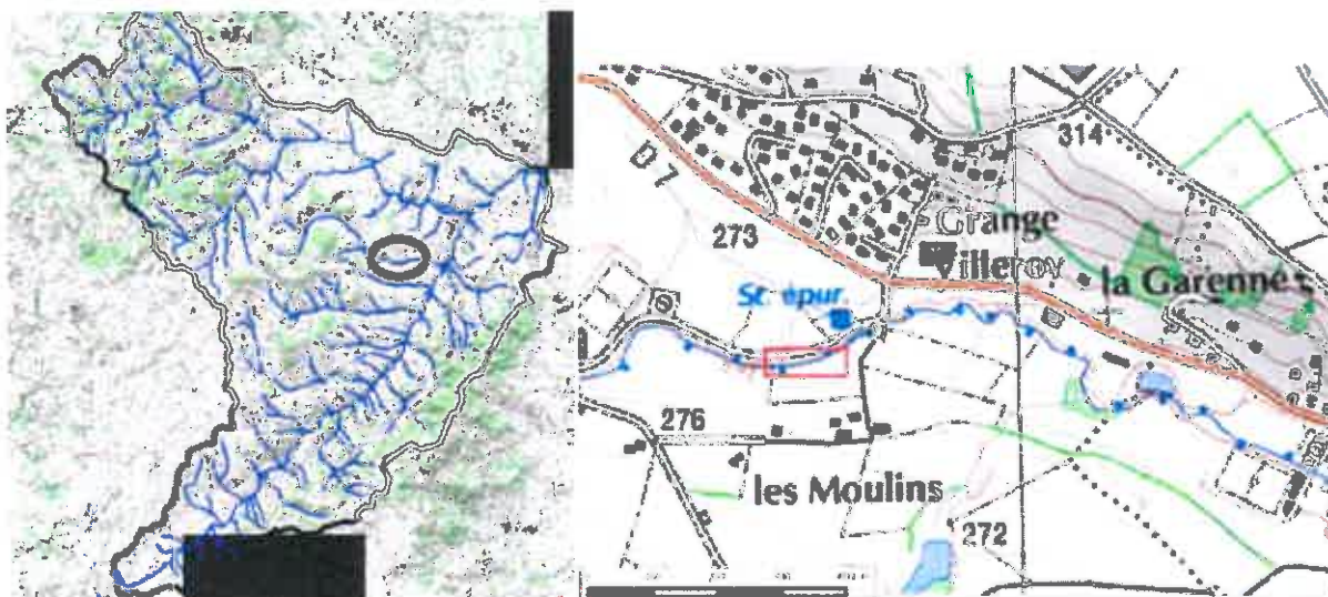
Localisation du projet au sein du bassin versant Brévenne Turdine et sur le cours du Trésoncle

Vu pour être annexé à l'arrêté N° DDT_SEN_2018_09_06_C95