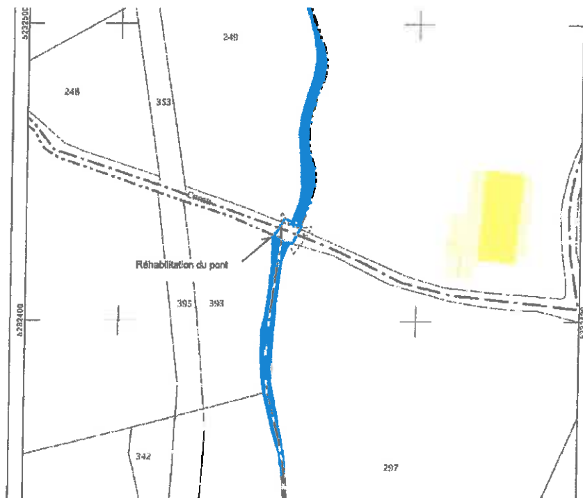
Extrait du plan cadastral

Pour les travaux, l'accès se fera, par les parcelles mentionnées ci-dessus et la surface impactée uniquement pendant la phase chantier pour la circulation des engins sera de 1 300 m 2 . Le terrain sera remis en état après travaux.