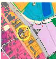
extrait de carte des enjeux de Loire/ Rhône avant modification