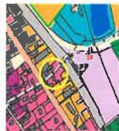
extrait de carte des enjeux de Loire/Rhône après modification

NB : pas de modification de la carte de zonage (zone urbanisée)