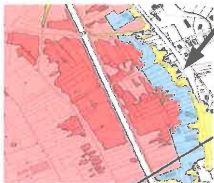
carte de zonage d'Ampuis - secteur de La Taquière -