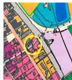
extrait de carte des enjeux de Loire/Rhône après modification

NB : pas de modification de la carte de zonage (zone urbanisée)