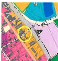
extrait de carte des enjeux de Loire/ Rhône avant modification