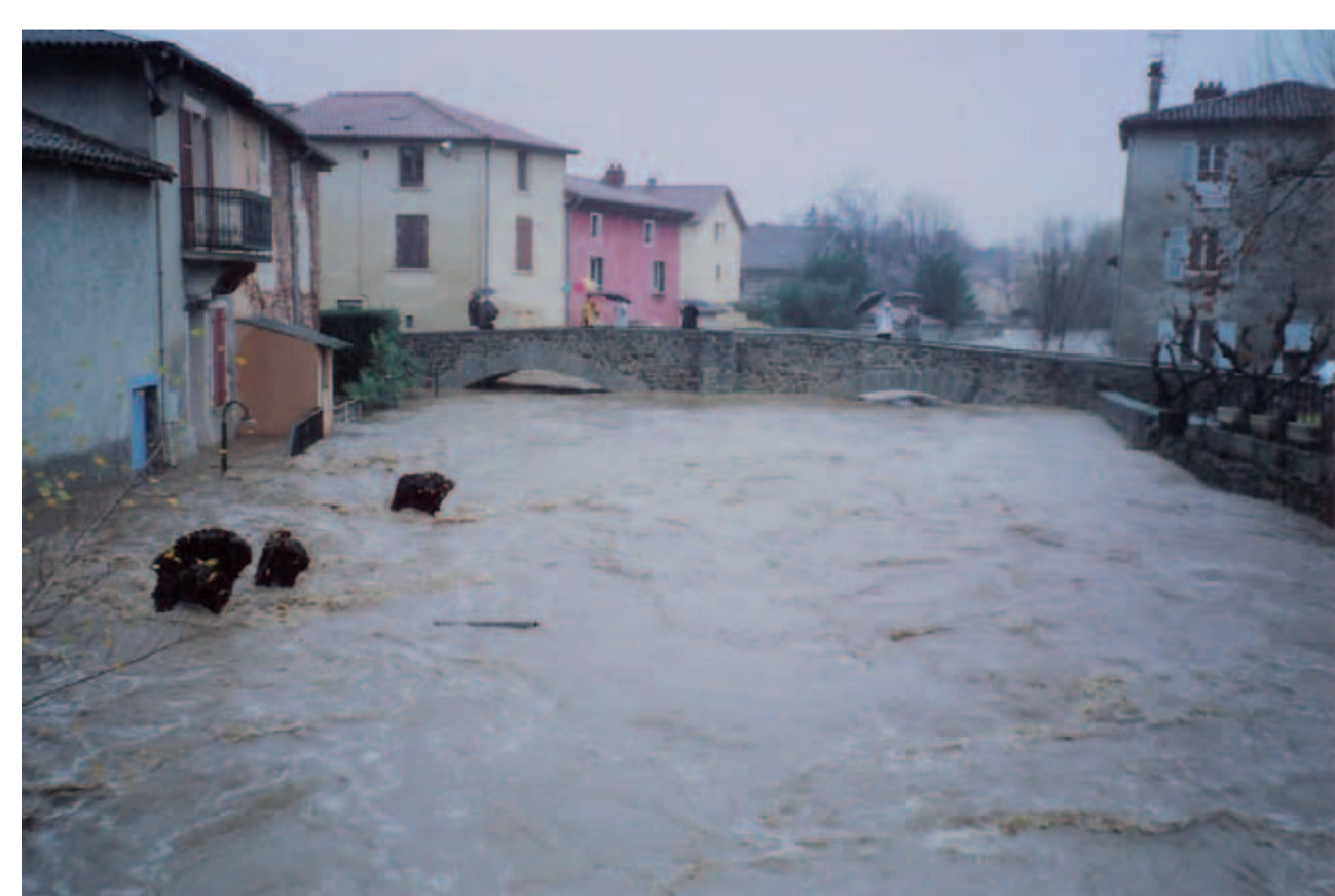
Crue de décembre 2003 Brignais - Vieux Pont

Le bassin versant du Garon est concerné par des crues rapides . Ces trente dernières années, plusieurs crues significatives se sont produites : 1983, 1993, 2003, 2005, 2008. La crue de 2003 est la crue connue la plus importante ayant eu lieu sur le bassin versant parmi les crues récentes.