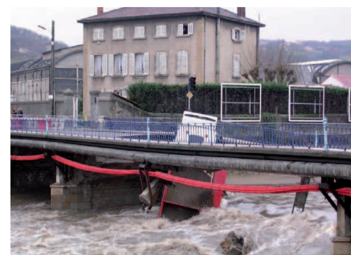
Givors - inondation 2003