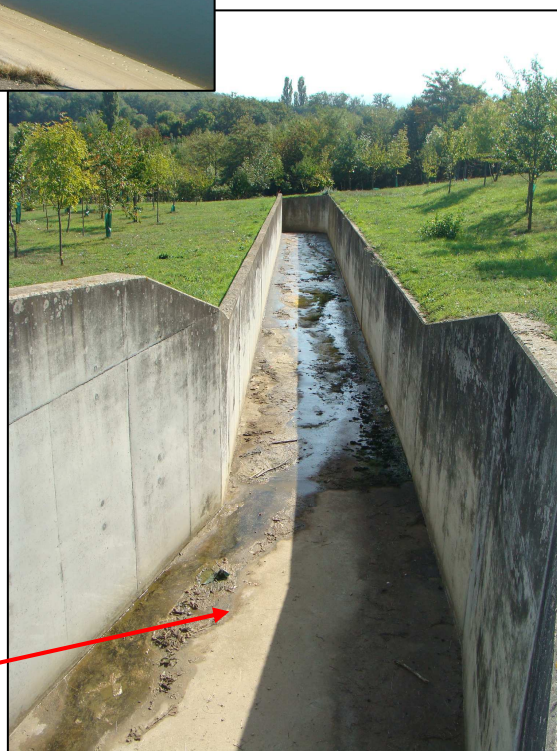
Déversoir en glissière béton