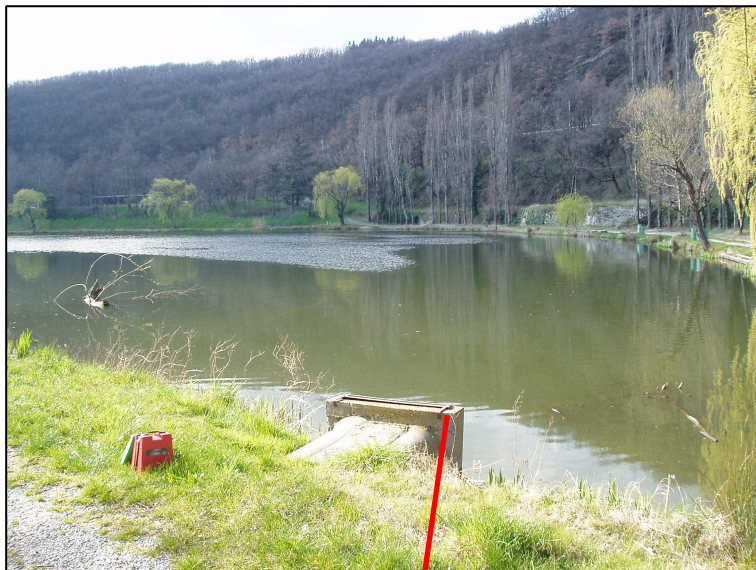
PE 1112 : Vue d'ensemble