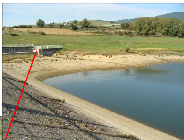
Le Corsenat amont