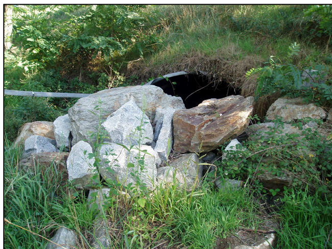
Buse aval pour l'expansion des crues du Gier