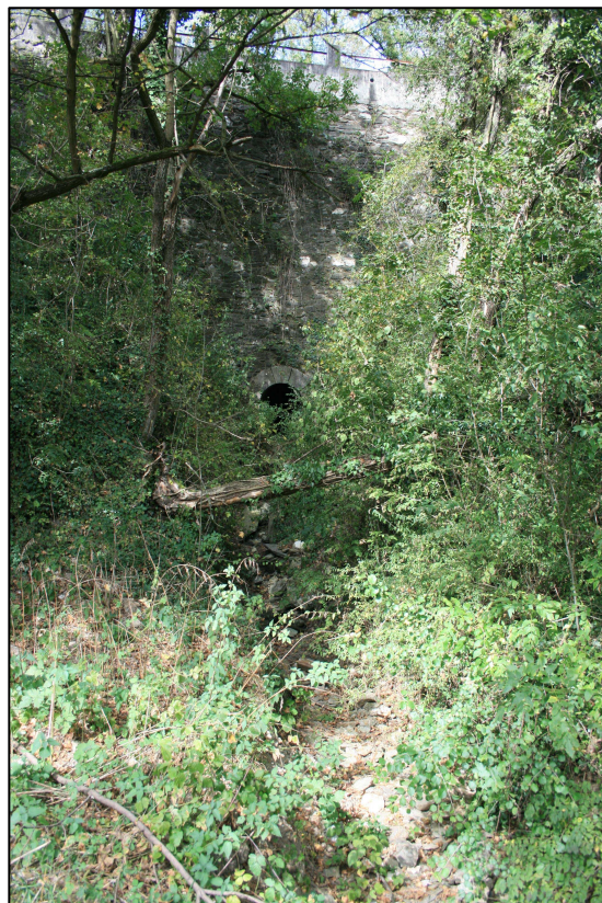
Ruisseau le Pied Viel, sans écoulement, après passage sous la D488