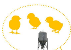
Facteurs Indépendants de l'éleveur