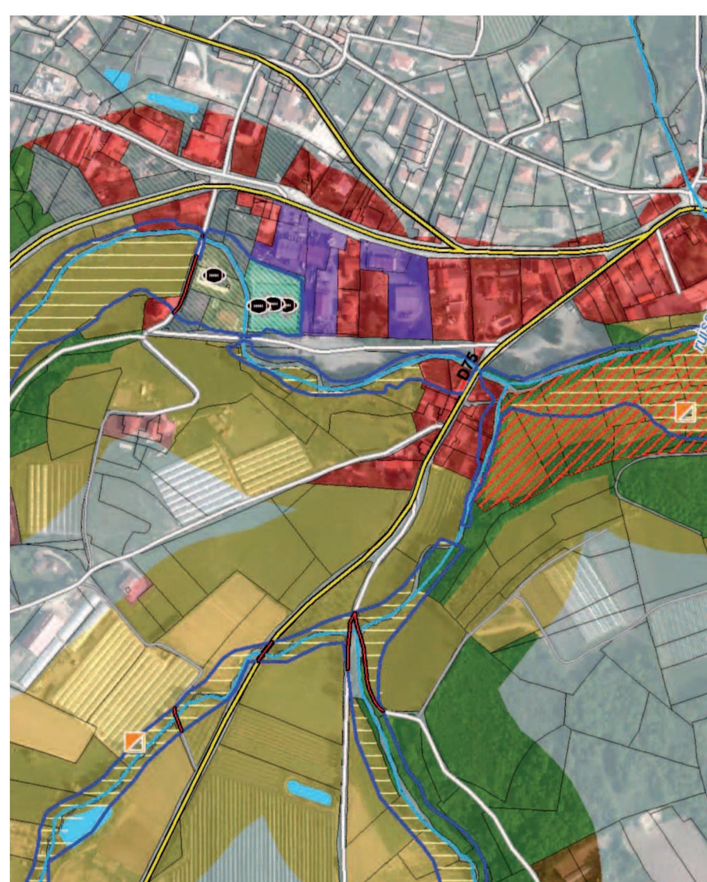
Exemple carte des enjeux