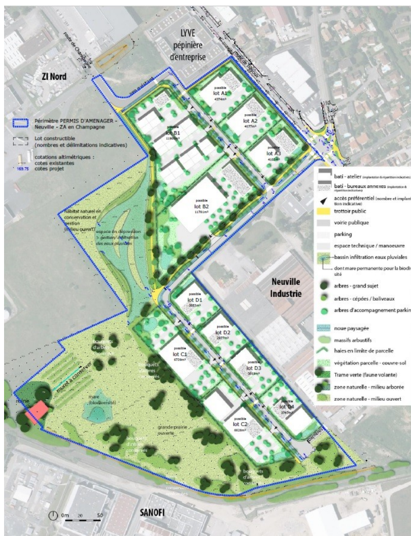
Figure 2: Programmation de la Zone d'activités En Champagne

ciens, couvreur, plombier, activités en lien avec le BTP), de petites industries (petite unité de production, ou activité artisanale qui dépasse le seuil des dix salariés), des activités industrielles classiques ainsi que des services connexes et accessoires aux entreprises industrielles.