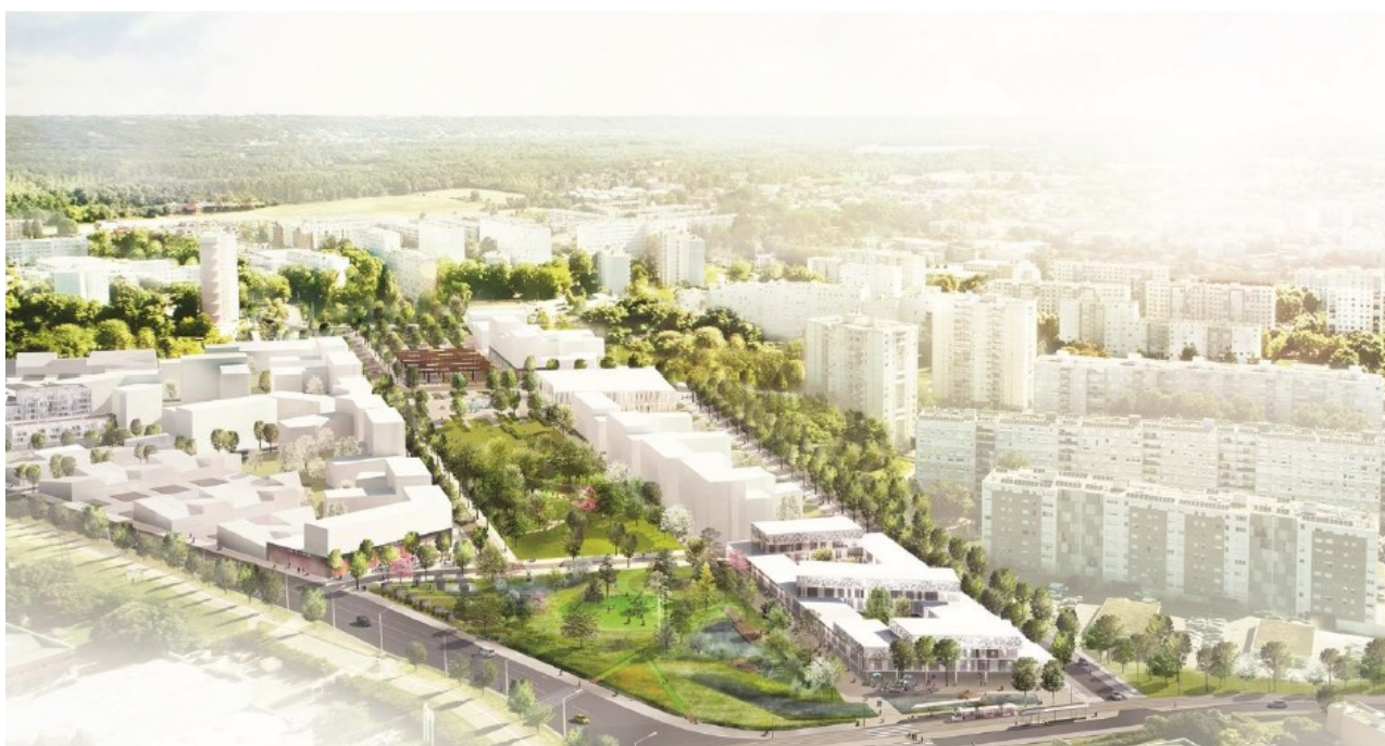
Figure 1: Vue aérienne du projet

La société d'équipement et d'aménagement du Rhône et de Lyon (SERL) a été désignée comme aménageur de la ZAC du Mas du Taureau, dans le cadre d'une concession d'aménagement signée le 4 novembre 2019 avec la Métropole de Lyon et pour une durée de 15 ans.