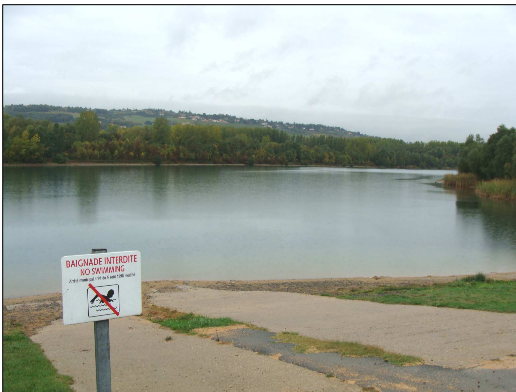
PE 976 : Vue d'ensemble et réglementation affichée