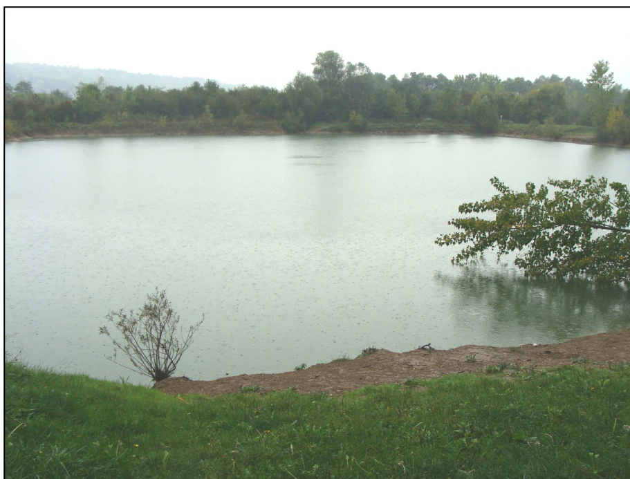
PE 977 : Vue d'ensemble