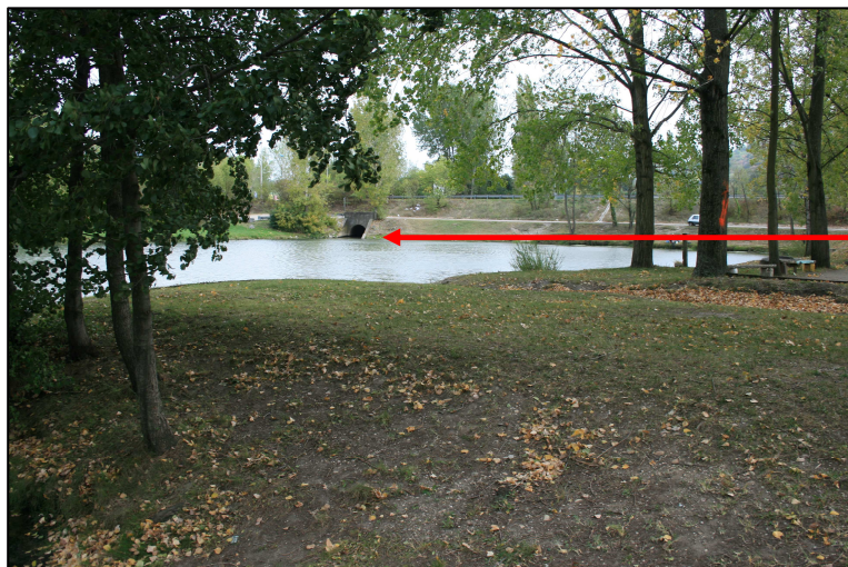
Lône du Prin