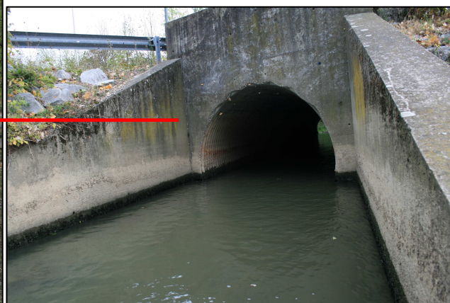
Exutoire vers la zone humide (passage sous la route)