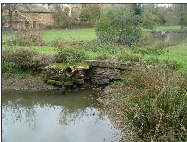
Jonction entre PE 1263 (devant) et PE 356 (au fond) ; le ru du Moulin longe la maison à gauche)