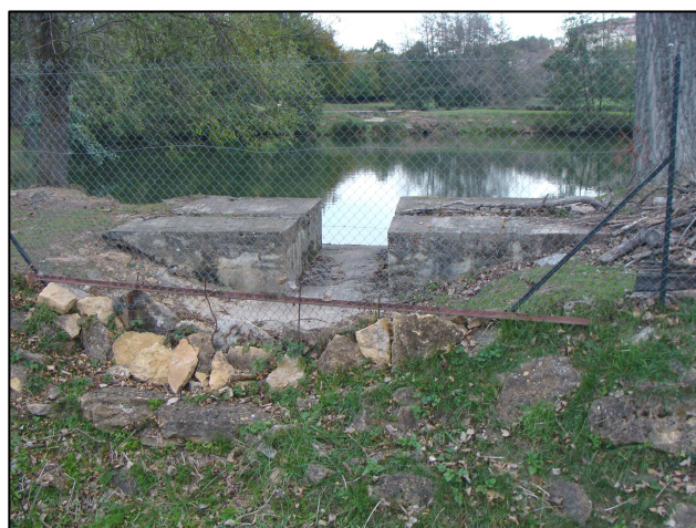
Plan d'eau 358 : Vue depuis l'aval + exutoire de surverse