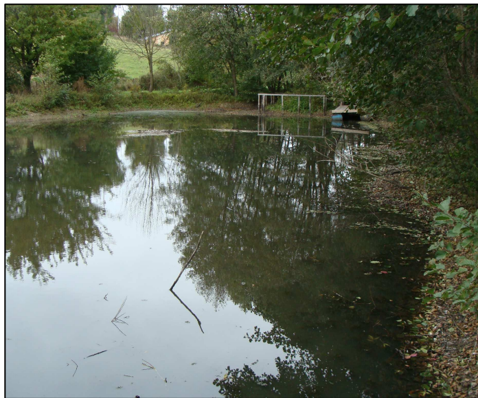
Plan d'eau 1263 (en aval du 1262)