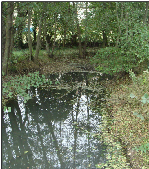
Plan d'eau 1262 (sans tributaire)