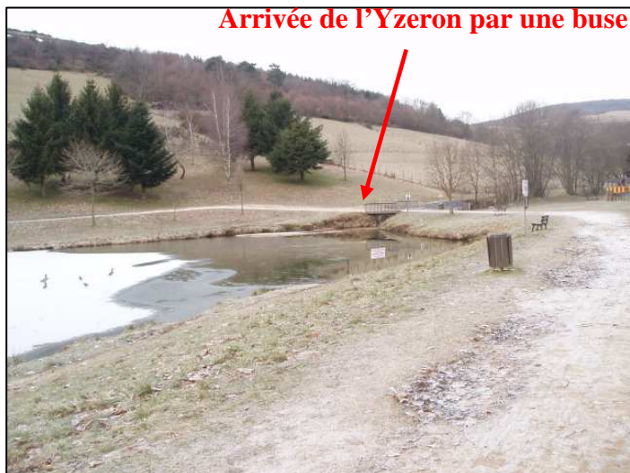
PE 66 : Vue amont depuis la rive gauche