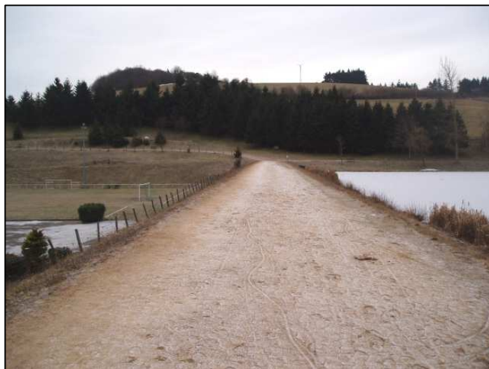
Digue à l'aval du PE