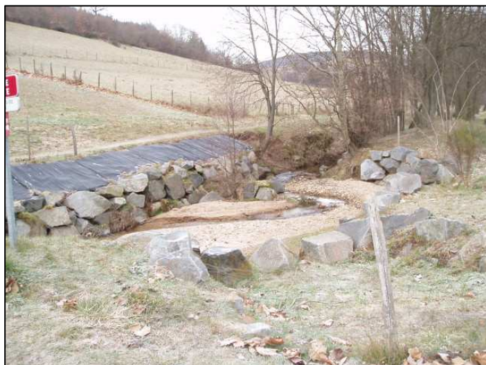
Dessableur, en amont du PE