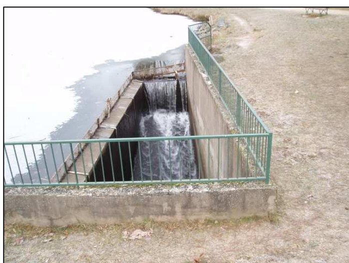
Déversoir + glissière béton