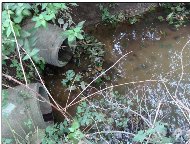
Arrivée de 2 drains, sans valeur piscicole