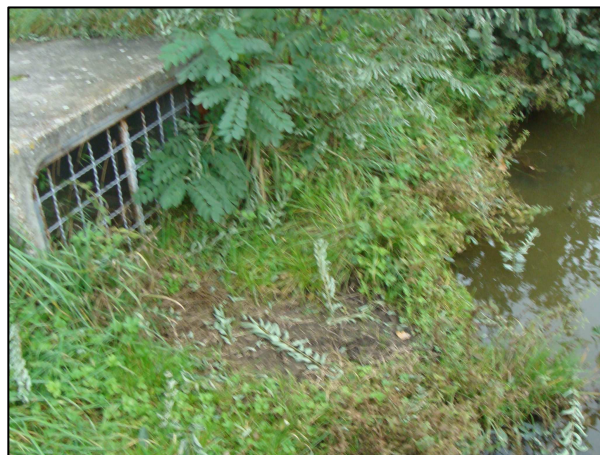
Exutoire de surverse