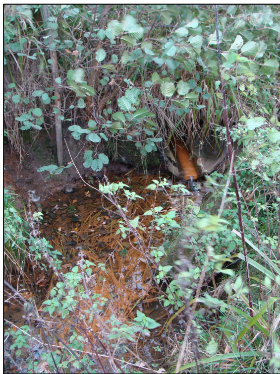
Rejet de l'exutoire central du PE, vers le ruisseau aval