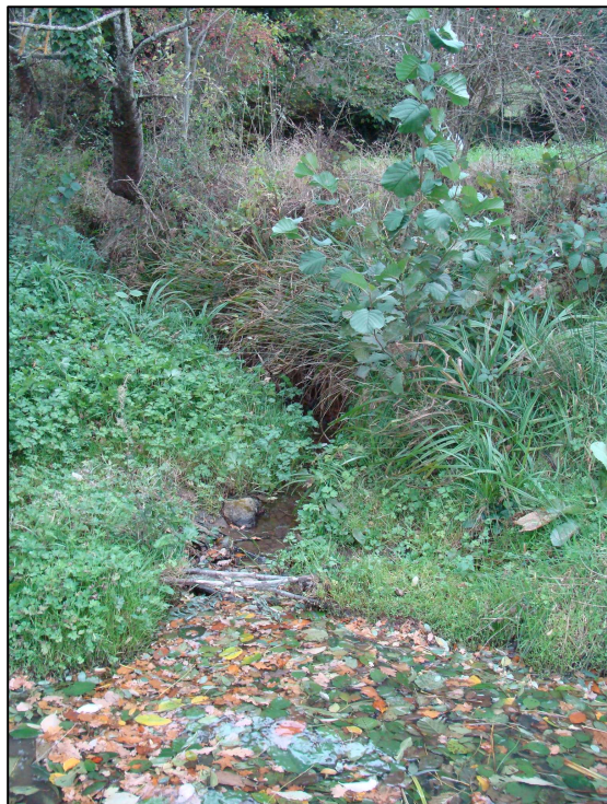
Ruisseau amont, non piscicole