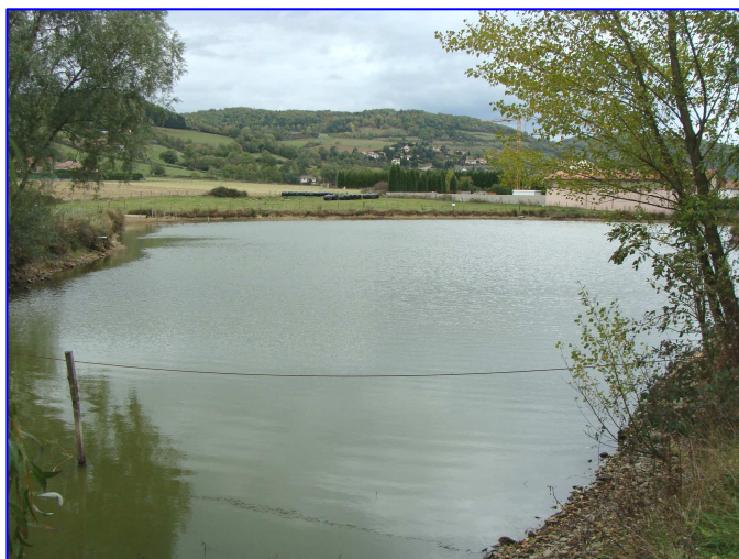
Plan d'eau 168 – Vue d'ensemble