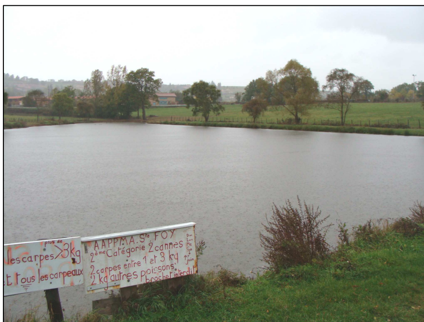
PE 1248 : Vue d'ensemble