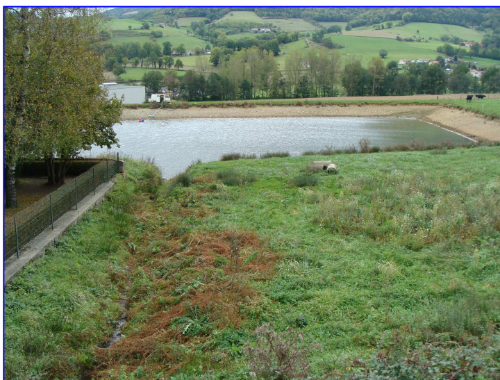
Retenue d'eau 319 à usage agricole