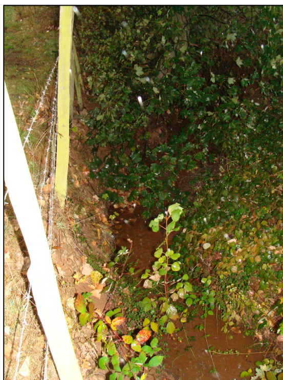
Fossé récepteur à l'aval