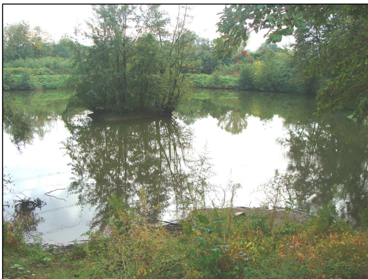
PE 1277 : Vue d'ensemble et chaussée sableuse entre plan d'eau et Azergues