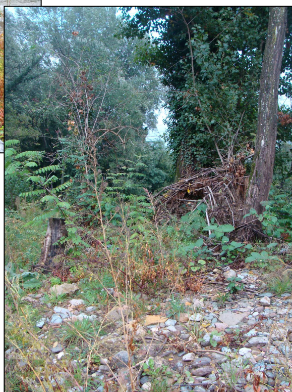
Brèche entre le PE et l'Azergues, avec laisses de crue