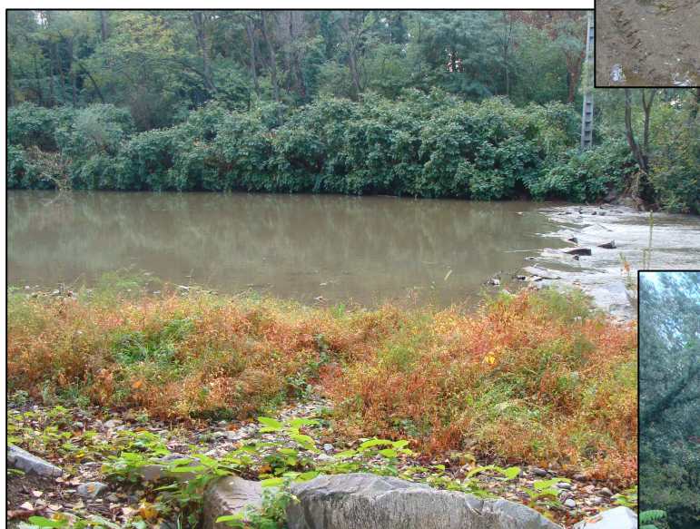
L'Azergues au droit du site