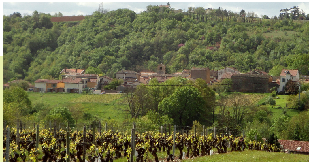
Une opération s'insérant dans le paysage