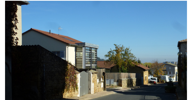
L'opération d'habitat collectif s'intègre dans le contexte villageois