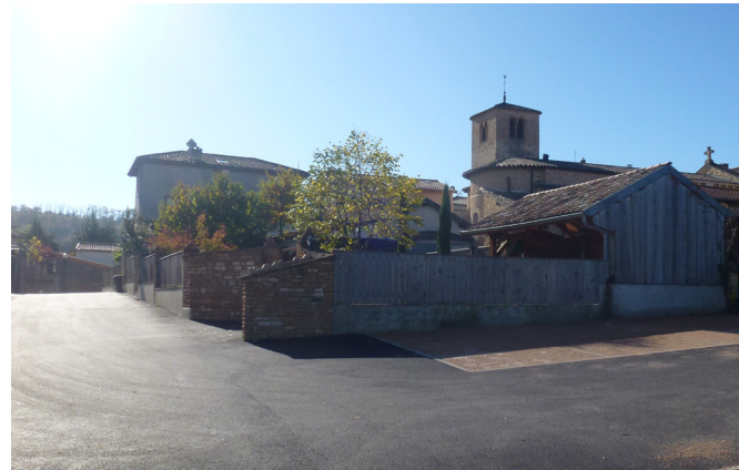
Une localisation en centre village