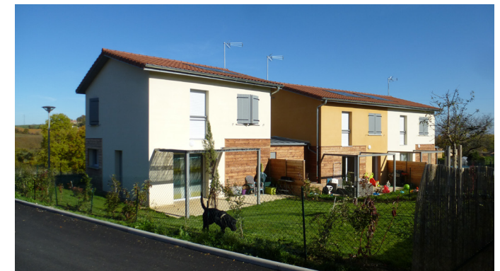
Une diversité des formes d'habitat

INSERTION architecture Contexte local Volumétrie Dent creuse Village DENSITE