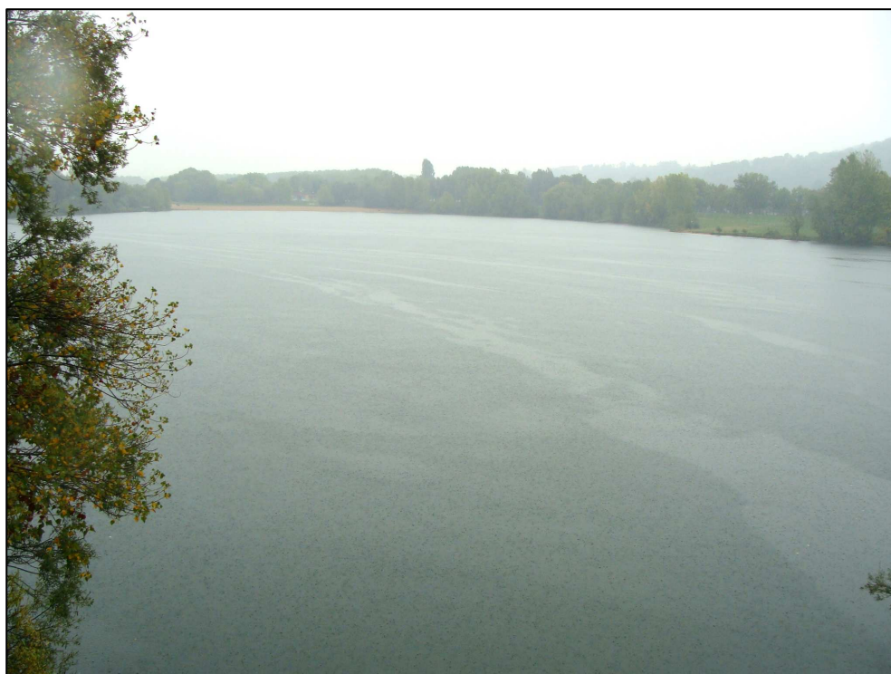
PE 975 : Vue d'ensemble