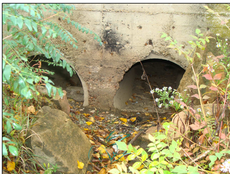
Exutoire du bassin d'orage, dans le PE