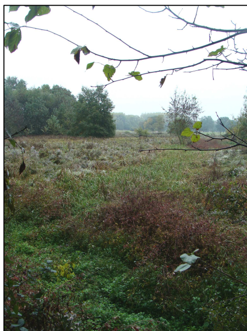
Le PE se termine en zone humide