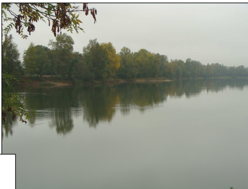
PE 967 : Vue d'ensemble