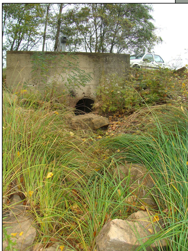
Fossé alimentant le PE, à sec le jour de la visite