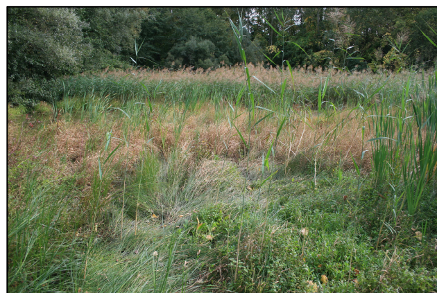
Division du PE par un merlon boisé et une roselière, laissant l'eau circulée librement