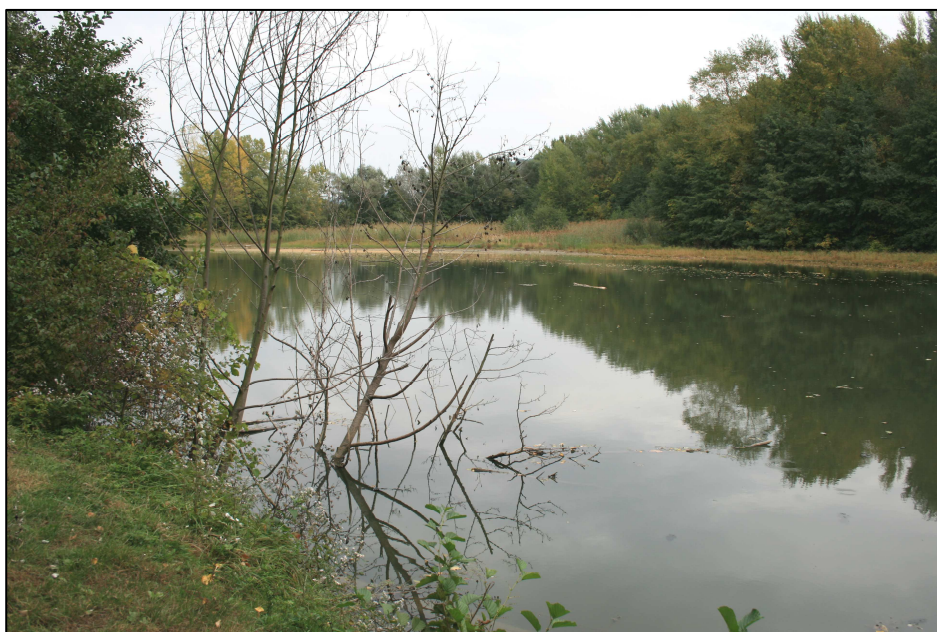
Plan d'eau 984 : Vue d'ensemble