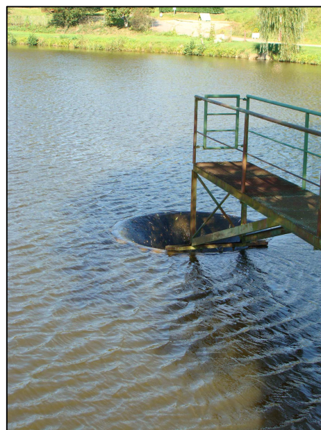
Entonnoir de sortie