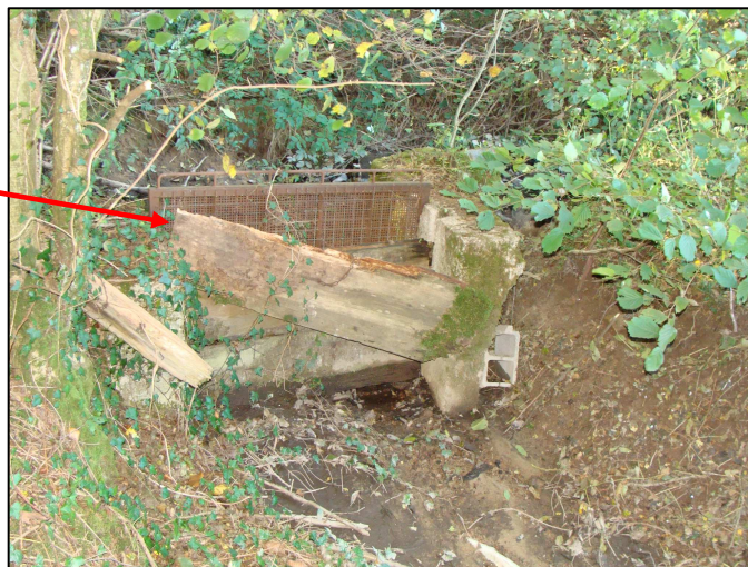
Grille métallique ; côté bief