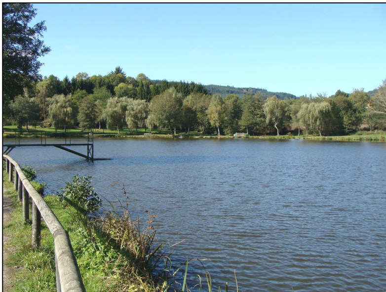
PE 111 : Vue d'ensemble