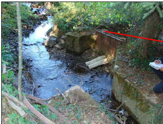
Prise d'eau par batardeau avec grille métallique