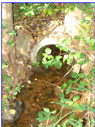
Ci-dessus : vanne d'alimentation amont Ci-contre : tabouret-déversoir aval et sa buse exutoire dans le Rhins