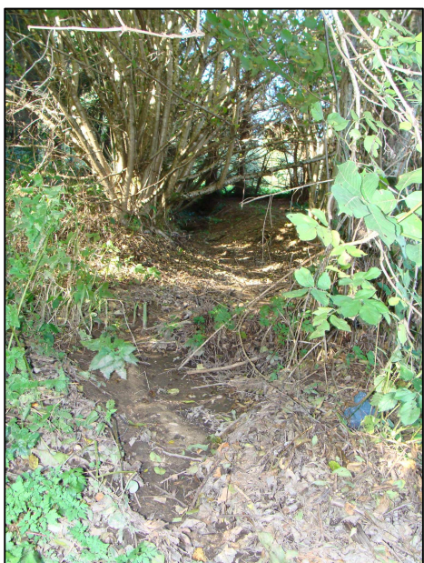
Bief en amont du PE