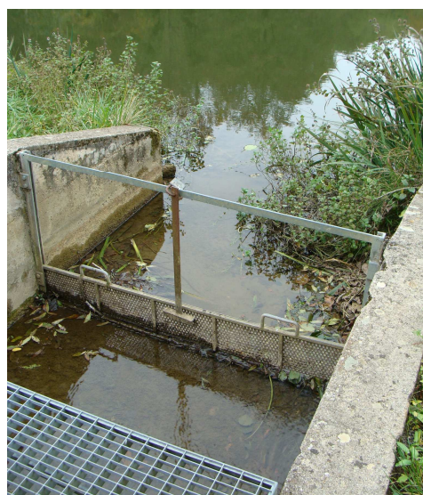
Exutoire du PE 112 (vue ci-contre)