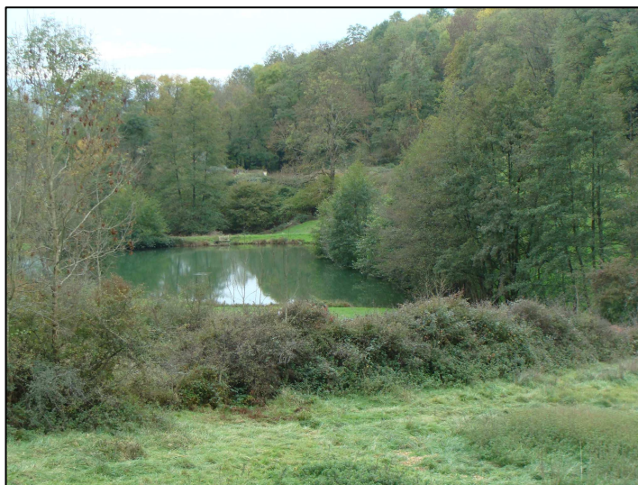
Ruisseau du Nizy en amont, et Plan d'eau 107