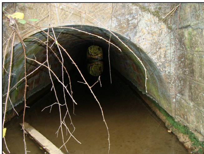
Passage libre du ruisseau, rejoignant le PE 116