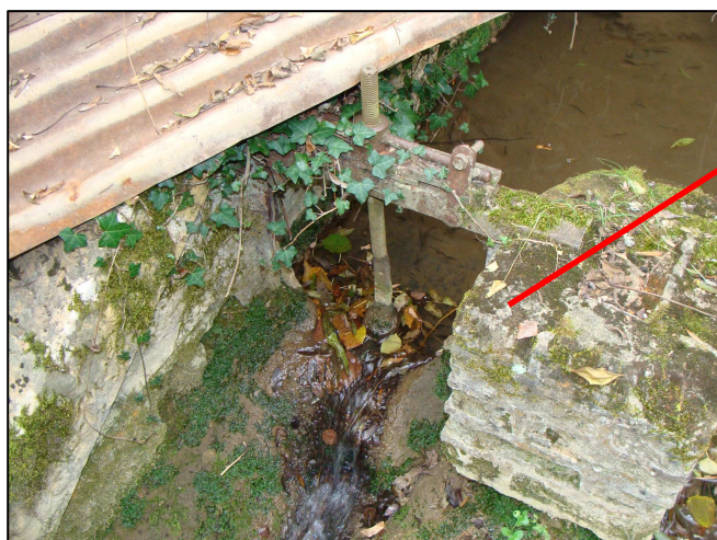
Prise d'eau libre vers le PE 116 (et ci-contre buse de communication entre le PE 116 et le PE 112)