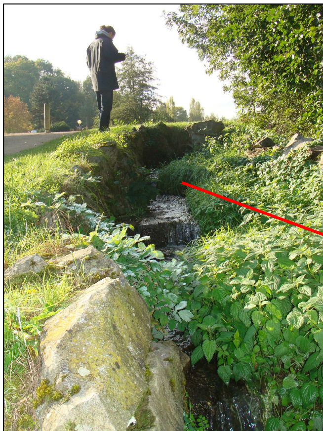
Exutoire du PE qui transite par une mare