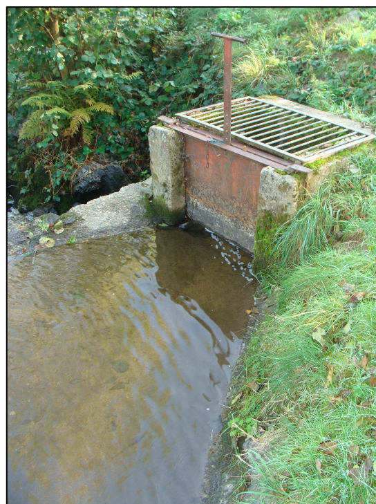
Prise d'eau sur la Grosne, par l'intermédiaire d'un seuil