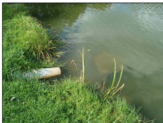
Prise d'eau dans le ruisseau Le Mousset Arrivée au niveau du PE 1239