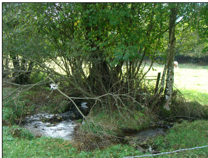
ruisseau Le Mousset en dérivation