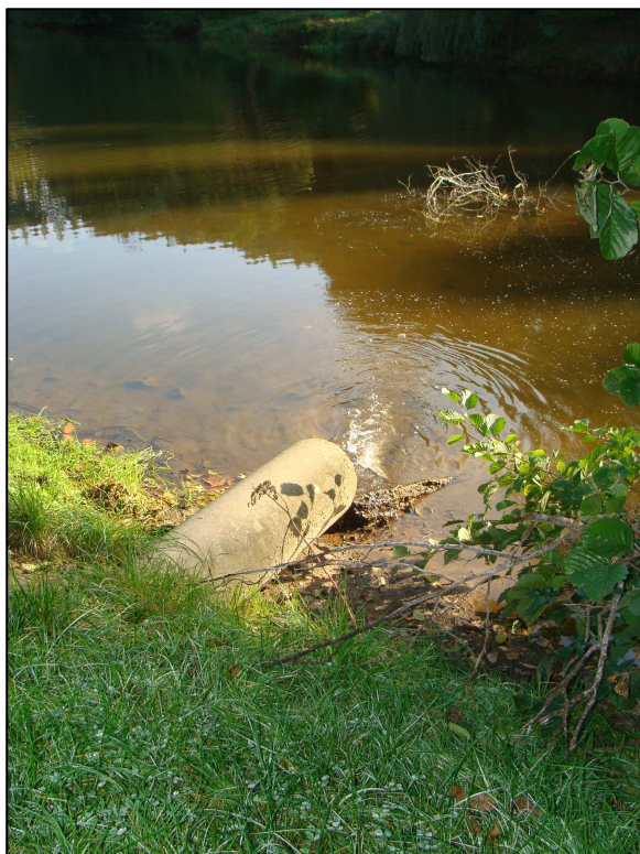
Rejet de la prise d'eau au niveau du PE, par l'intermédiaire d'une buse enterrée