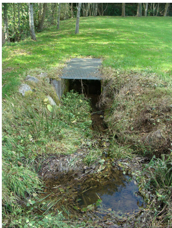
Drain qui converge vers l'entrée du PE 126