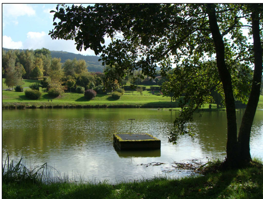
Tabouret déversoir du PE 126