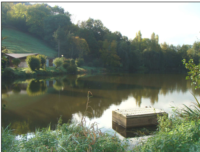
PE 240 : Vue d'ensemble, avec tabouret déversoir