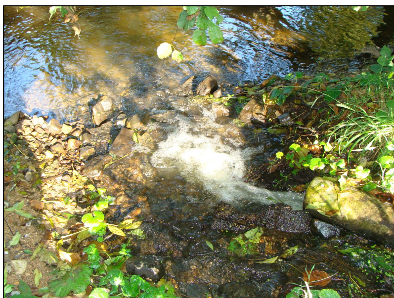
Exutoire final au sortie de la marre, dans la Grosne