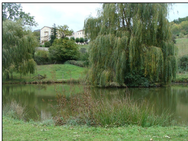
Plan d'eau privé 1038, en contre bas du 1037