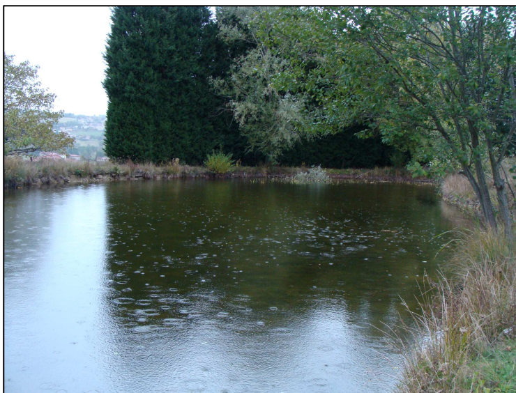
Plan d'eau 1037 du centre médical – Vue d'ensemble